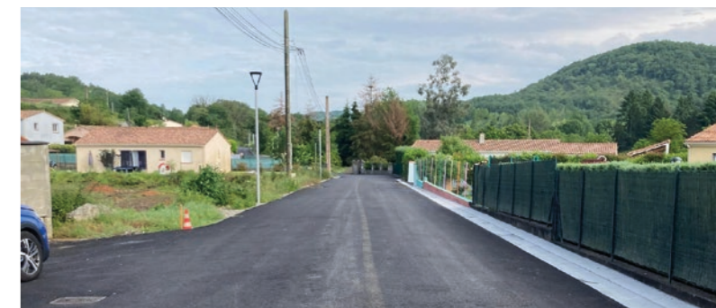
Ci-dessus : Travaux de voirie chemin de Garrigous Ci-dessous : Consolidation du mur du cimetière